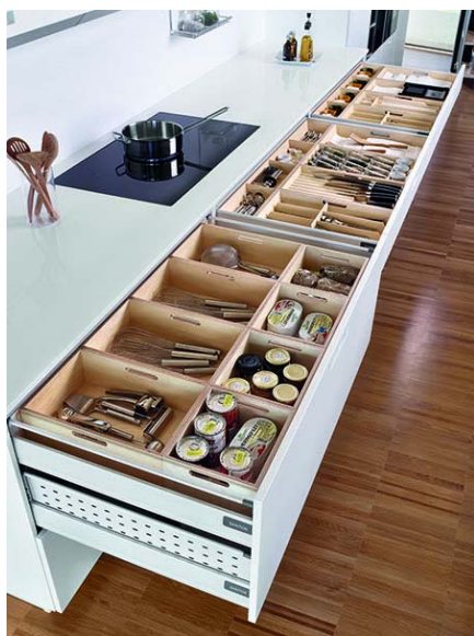
Código imagen: 009880I75D2010