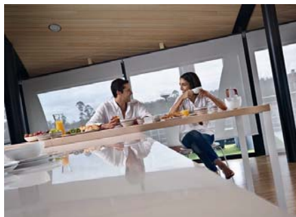
Código imagen: 009880P71D2010