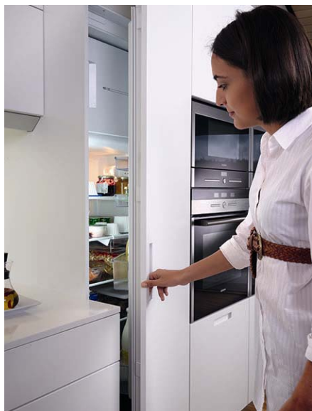
Código imagen: 009880I68D2010