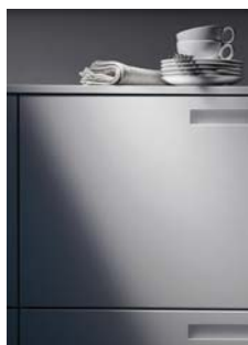
Código imagen: 009880F85D2010