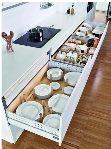
Código imagen: 009880I76D2010