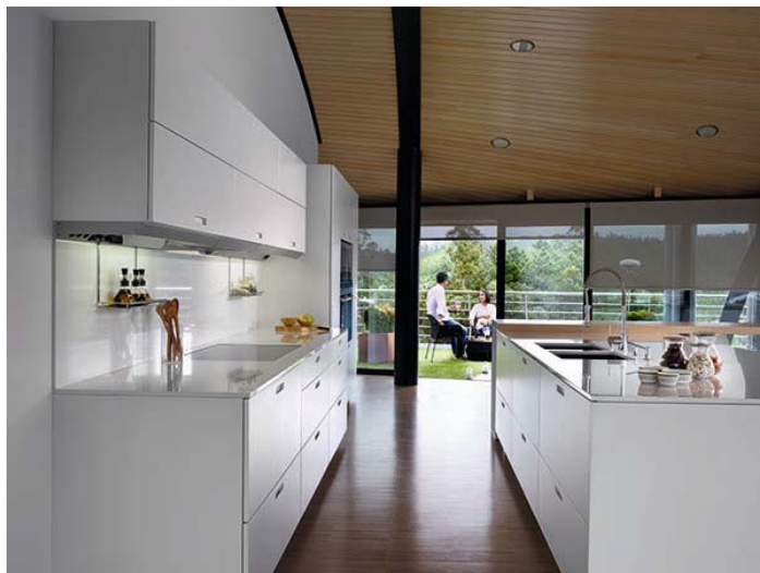
Código imagen: 009880P13D2010