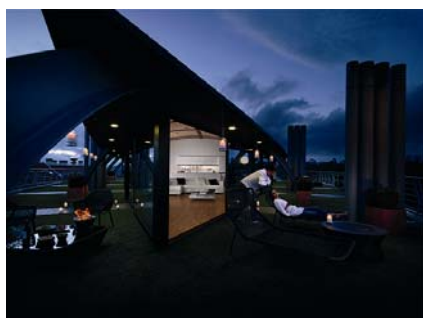
Código imagen: 009880P25D2010