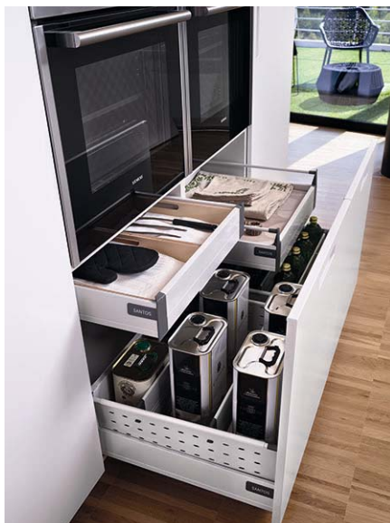
Código imagen: 009880I69D2010