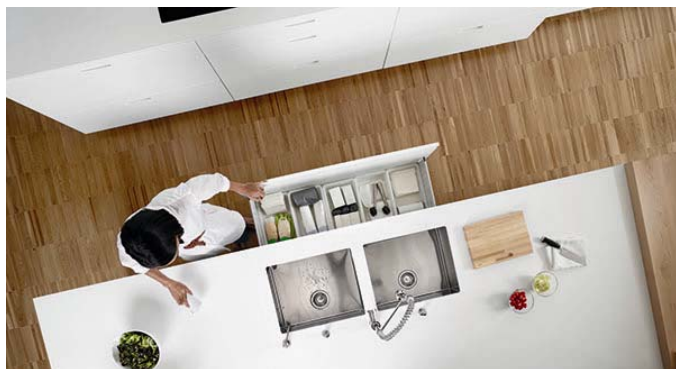
Código imagen: 009880Z66D2010