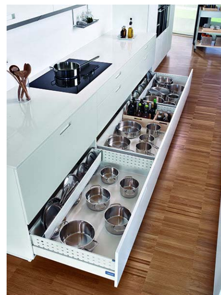
Código imagen: 009880I77D2010