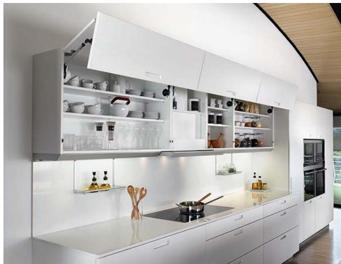
Código imagen: 009880G20D2010