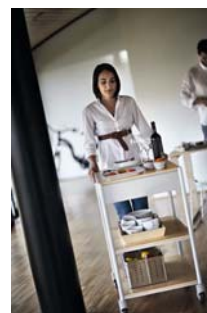
Código imagen: 009880P92D2010