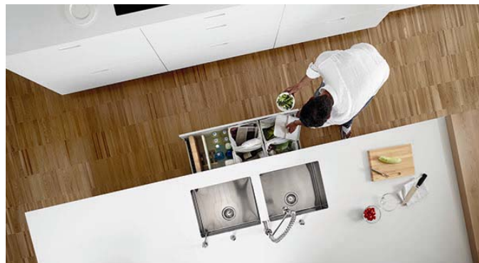
Código imagen: 009880Z64D2010