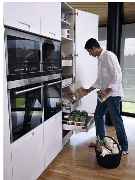
Código imagen: 009880I70D2010