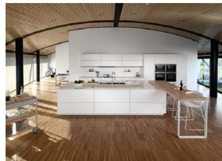
Código imagen: 009880G11D2010